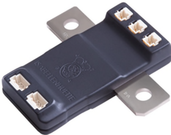
電流センサモジュール「IVT-S」シリーズ

加賀電子はIVT-SシリーズでEV、PHEV、FCVなどの次世代自動車におけるBMS（バッテリーマネジメントシステム）での需要を見込み、中期的にシェア25%を目指します。