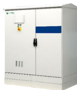
産業用蓄電システム BLP® 〈Energy Storage System〉