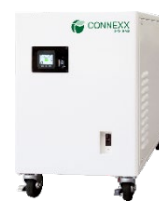
非常用小型蓄電池 『LB0043PE4』

当社は、今般の出資を通じて、CONNEXX SYSTEMS 社が持つ蓄電技術および蓄電システム製品群を活かし、当社グループが展開する太陽光発電システムや電力インフラなどの販売・サービスにおいて、需要家の規模やニーズに応じて最適な蓄電システムを提供するセットソリューションを強化、加速いたします。また、中古 EV バッテリーのリユース事業の将来展開においては、当社グループのグローバルネットワークを最大限活用し、同社との協業を進めて参ります。