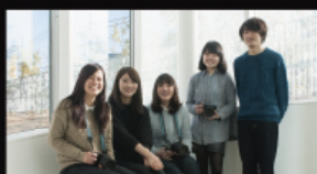
東京工芸大学 Tokyo Polytechnic University