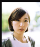
高木 こずえ Cozue Takagi

1976年東京都生まれ。明治学院大学社会学部社会学福祉学科卒業。写真家テラウチマサト氏に師事。写真雑誌「PHaT PHOTO」の立ち上げの参加。編集者としても活動。2003年独立。コマーシャル全般の撮影のほか、写真・カメラ雑誌での執筆も多数。ライティングセミナー多数。著書多数。最新刊は「仕事に使える写真術」(翔泳社)「美しいポケの教科書」(共著/技術評論社)。Profoto公認トレーナー。