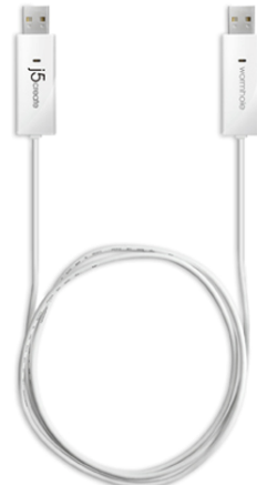
価格 1,980 円(税込) ※参考店頭販売価格

<リンクケーブル“wormhole switch (ワームホールスイッチ) JUC400”、“wormhole switch JUC100”の特徴>