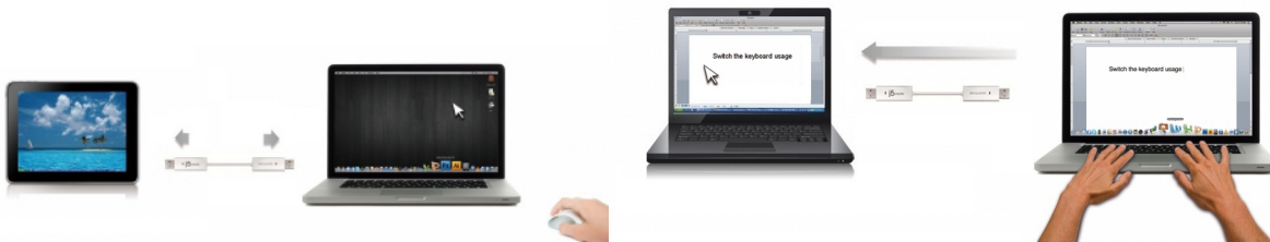
[マウスの共有のイメージ]

wormhole switchで接続された2台のPC間で、マウス操作、キーボード入力がどちらからでも操作できます。片方のマウス、キーボードで両方のPC操作が可能です。しかも、異なるOS間での共有もサポート。Windows ⇄ mac 間での共有も可能です。