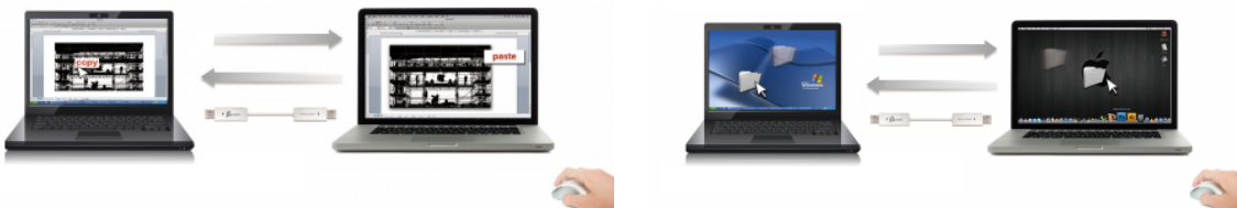
[コピーアンドペーストのイメージ]

wormhole switchで接続された2台のPC間で、コピーアンドペースト、ドラッグアンドドロップによるデータ移動が可能。写真や動画といった大容量のデータでも、外部ストレージに移したり、ネットワークに接続することなく、ストレスフリーで転送ができます。