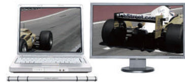
【プライマリーモード】