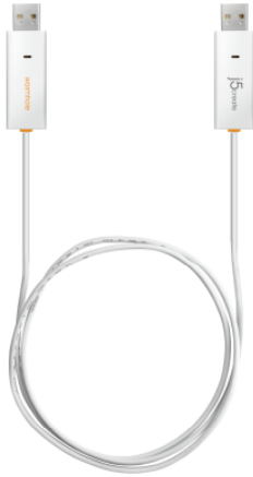
価格 2,980 円(税込) ※参考店頭販売価格

先進の wormhole switch 機能搭載！ USB 接続するだけでデータの移動、マウス、キーボードの共有ができる 『“リンクケーブルシリーズ”』 ラインナップ 『“wormhole switch JUC400”』, 『“wormhole switch JUC100”』