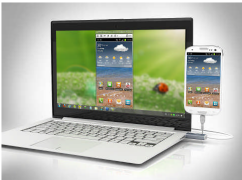
[スクリーンミラー機能]

USB 接続したアンドロイドスマートフォン、アンドロイドタブレット端末の画面がそのまま PC のディスプレイにミラー表示できます。表示された画面の拡大、縮小も可能。スマホ、タブレットの動きに連動した回転表示機能も搭載しています。