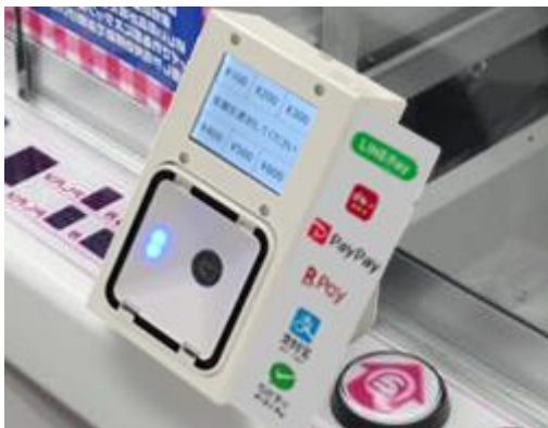
※画像は、試験運用に使用する決済端末（試作機）です。