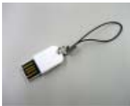
ミニサイズ USB メモリ

ジャンルにとらわれず、新たなコンテンツ、新製品、情報の提供を行い、企業間コラボレーションを図るなど、お客様、協力会社との双方向な情報交流の窓口として業務。