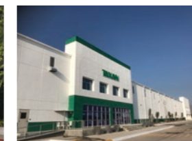
TAXAN MEXICO S.A.DE C.V.