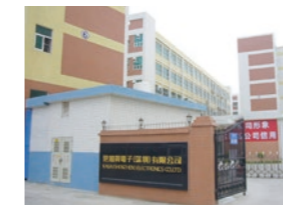
港加賀電子(深圳)有限公司