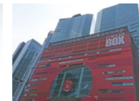
KAGA(H.K.) ELECTRONICS LIMITED