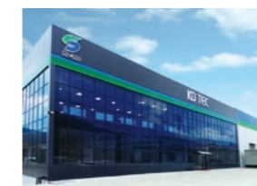
KD TEC TURKEY ELEKTRONIK SANAYI VE TICARET LIMITED SIRKETI