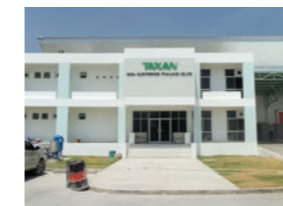
KAGA ELECTRONICS (THAILAND) COMPANY., LTD