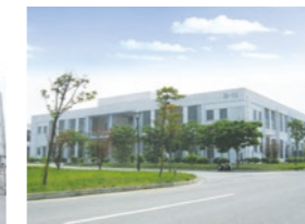
加賀沢山電子(蘇州)有限公司