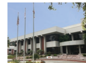
KAGA FEI AMERICA, Inc.