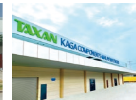
KAGA COMPONENTS (MALAYSIA) SDN.BHD.