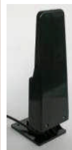
〔アンテナ例〕 *他推奨アンテナあり