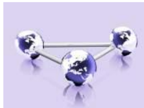
いつでもどこでも モバイルブロードバンド